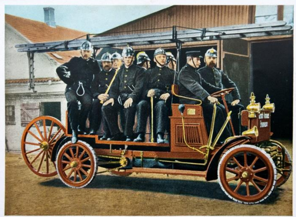
Den første Automobiloprige i Skandinavien var dansk — bygget paa „Anglo-Danish Fabrik“ i København 1907. Køretæghed 20 km/Time. Passedytelse 150 l/Mn.

Museet har en omfattende samling af både køretøjer og udstyr, go der vil være lejlighed til at se på meget af det, når der holdes stor parade og åbent hus i forbindelse med jubilæet 22. maj kl. 11.00 til 15.00. Museet ligger på Hellerupvej 5 B, og på dagen afspærres Hellerupvej, da der bliver parade og fremvisning af mange inviterede tidstypiske biler.